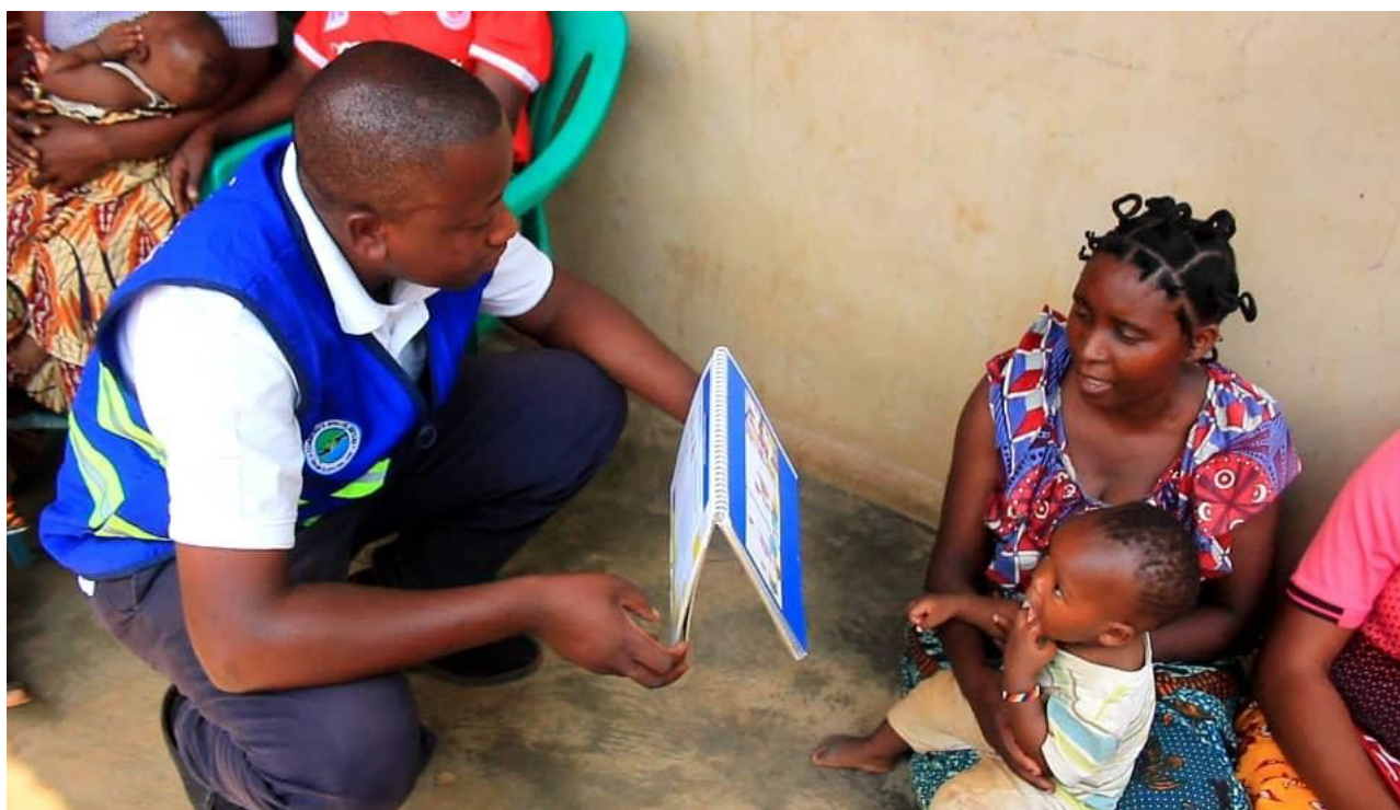
Serikali ya awamu ya sita inaendelea kuboresha huduma za Afya ya msingi ngazi ya jamii. Picha; Mhudumu wa Afya Ngazi ya Jamii (CHW) akihamasisha huduma za Kinga dhidi ya magonjwa katika ngazi ya jamii.