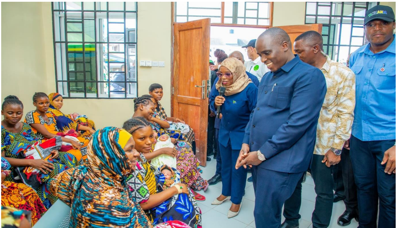
Naibu Waziri Mkuu na Waziri wa Nishati Mheshimiwa Dkt. Doto Mashaka Biteko akizungumza na wazazi waliofika katika zahanati ya Bungoni iliyopo Jijini Dar es Salaam kwa ajili ya kupata huduma za kliniki.