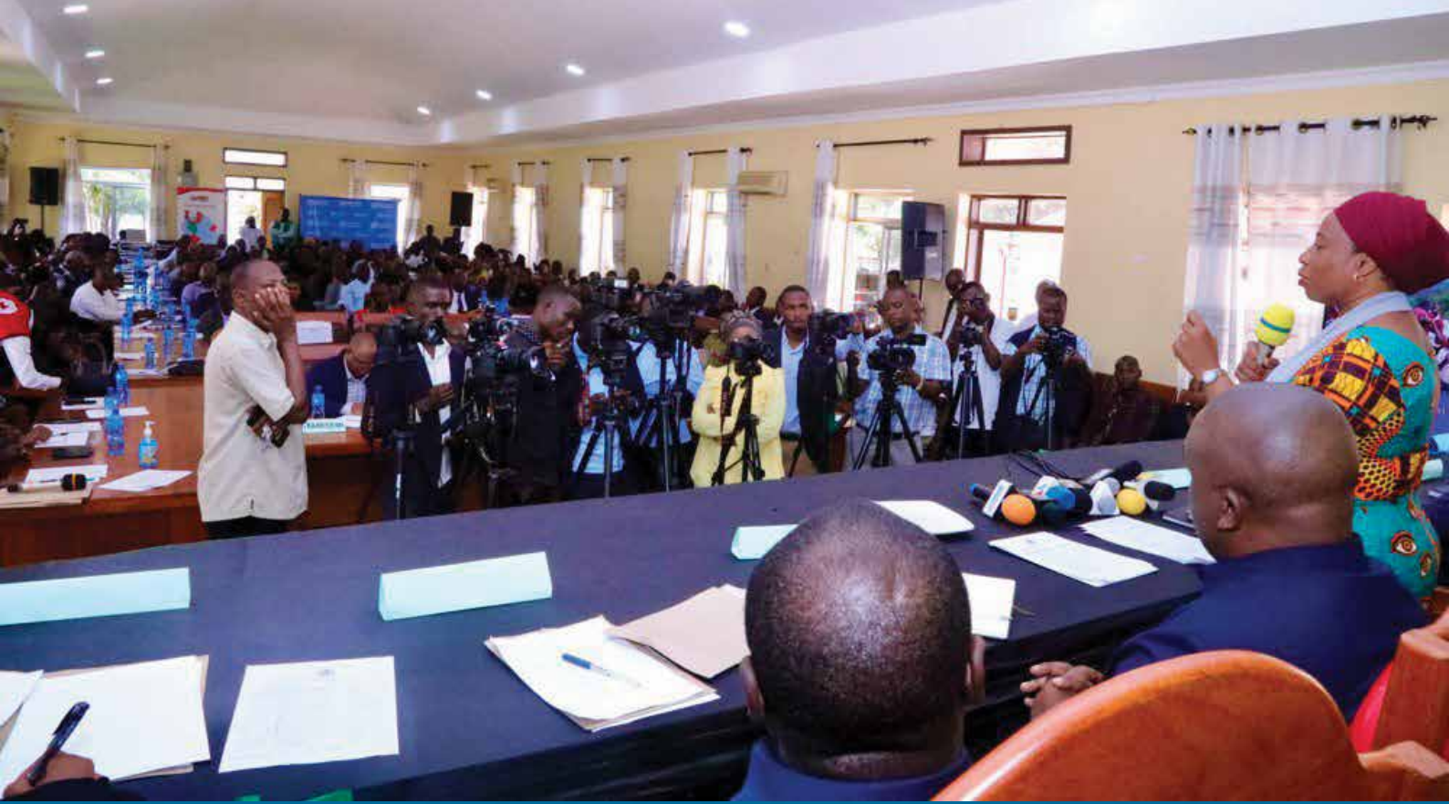
Waziri wa Afya Mhe. Umyy Mwalimu akitoa tamko la kilele cha mapambano dhidi ya Ugonjwa wa Margurg Kagera, Juni 2, 2023