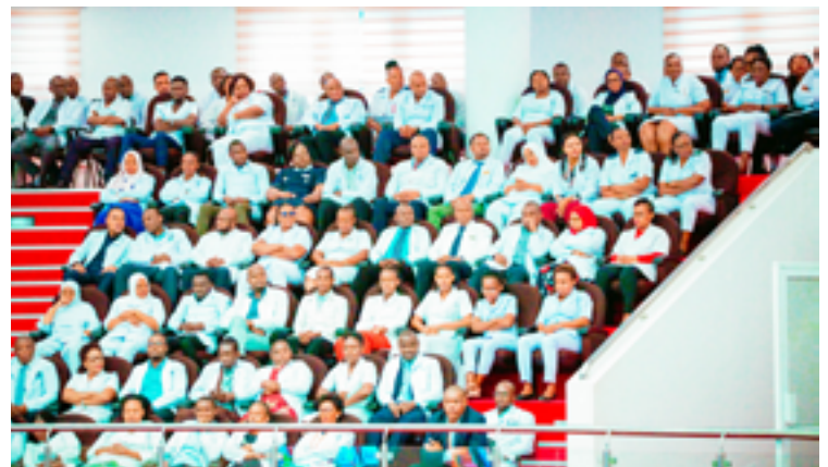
Timu ya madaktari bingwa 100 wa masuala ya afya ya uzazi, mama na mtoto ambao ni wageni waalikwa wa Waziri wa Afya Mhe. Umyy Mwalimu wakifuatilia uwasilishwaji wa hotuba ya bajeti ya Wizara ya Afya kwa mwaka wa fedha 2023/24.