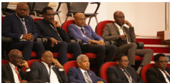
Viongozi wakuu wa Taasisi za Wizara ya Afya wakifuatilia uwasilishwaji wa hotuba ya bajeti ya Wizara ya Afya Bungeni.