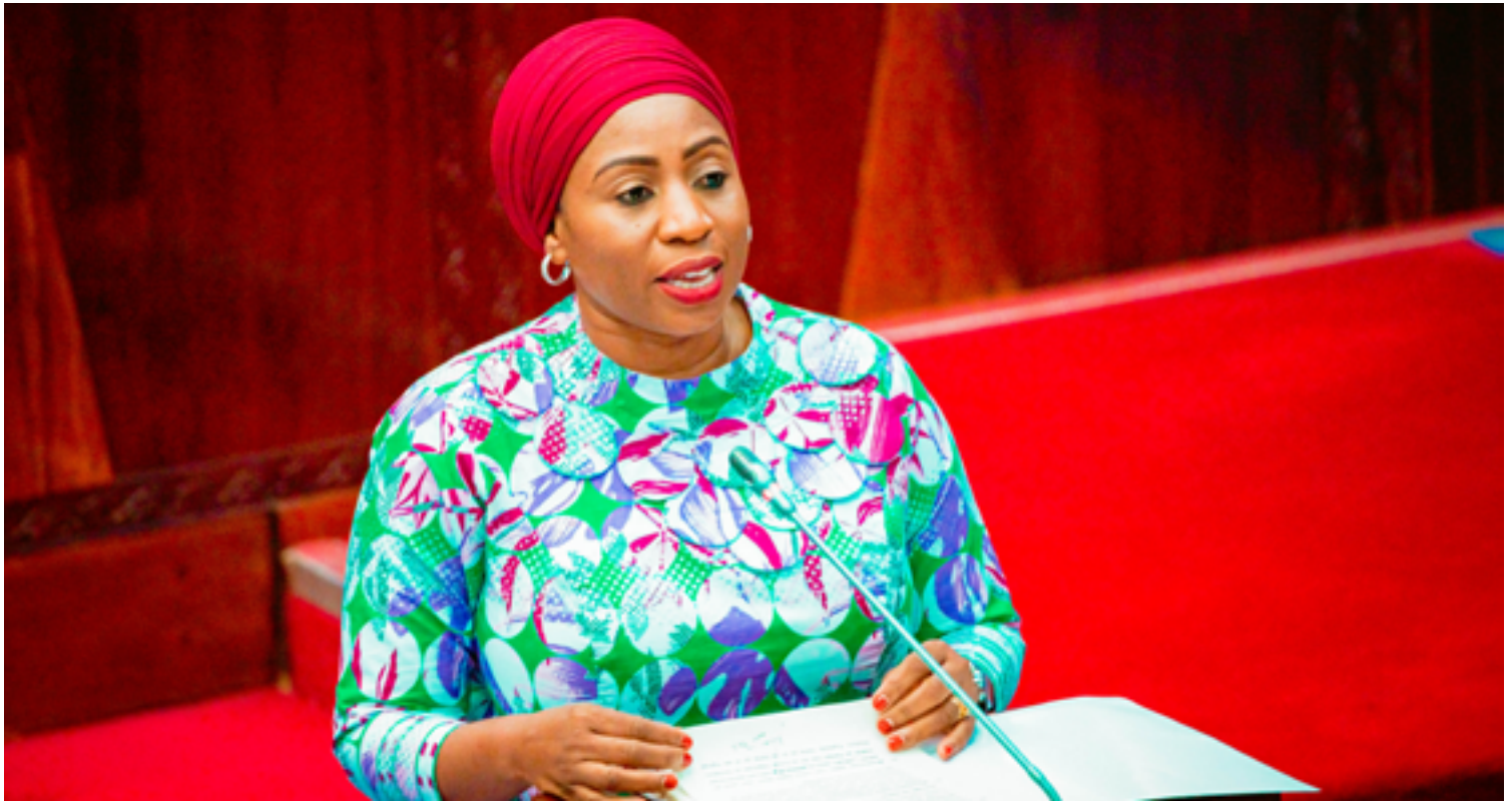
Waziri wa Afya Mhe. Umyy Mwalimu, akiwasilisha Hotuba ya Bajeti ya makadirio ya mapato na matumizi ya Wizara ya Afya kwa mwaka wa fedha 2024/24 Bungeni Jijini Dodoma.