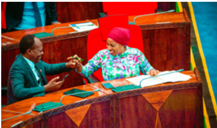
Waziri wa Afya Mhe. Umyy Mwalimu, akiteta jambo na Naibu Waziri wa Afya Mhe. Dkt. Godwin Mollel mara baada ya kuwasilisha Hotuba ya Bajeti ya makadirio ya mapato na matumizi ya Wizara ya Afya kwa mwaka wa fedha 2024/24 Bungeni Jijini Dodoma.