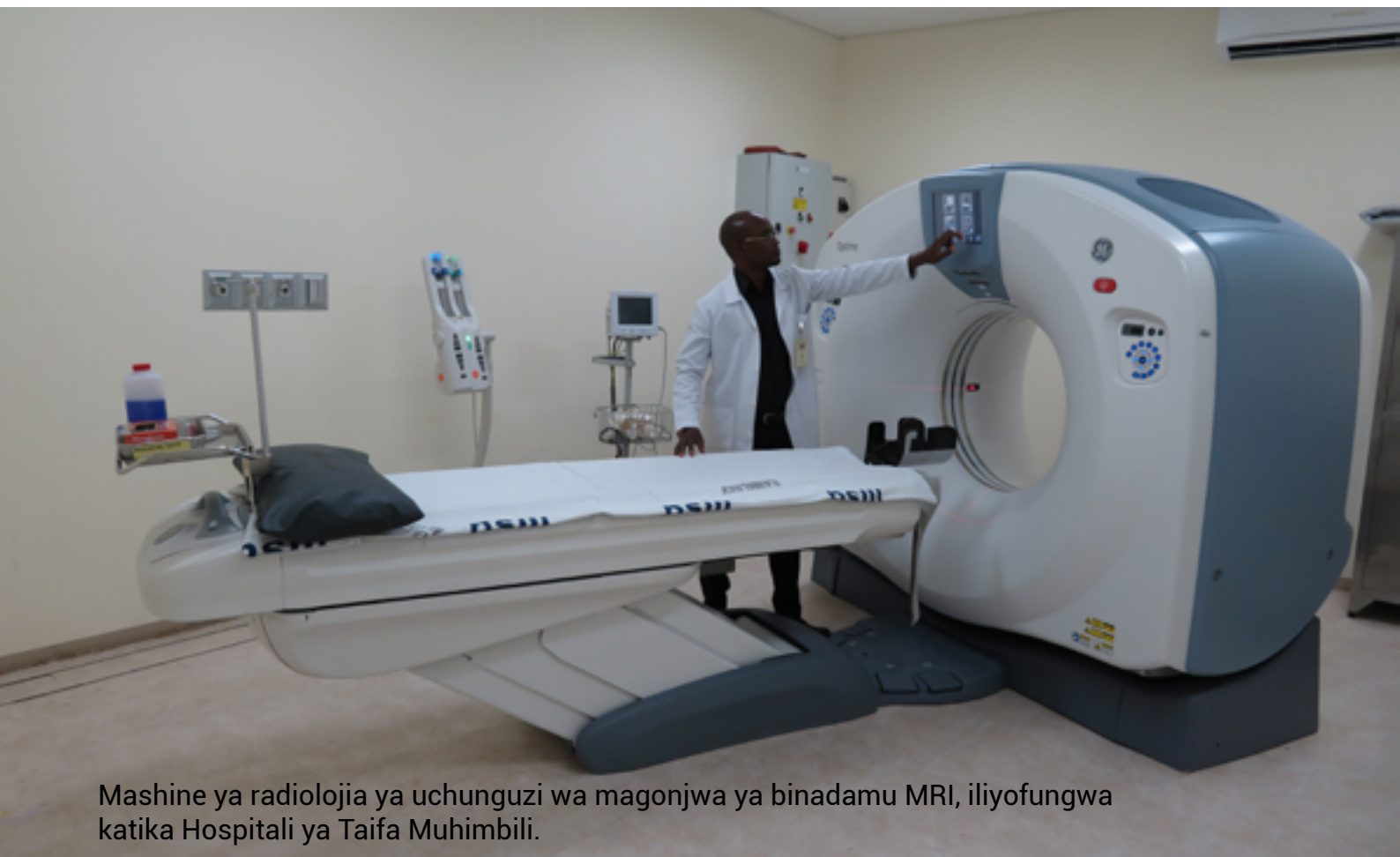
Mashine ya radiolojia ya uchunguzi wa magonjwa ya binadamu MRI, iliyofungwa katika Hospitali ya Taifa Muhimbili.

Hadi Machi, 2023, Wizara imefanikiwa kuanzisha vituo vipya 122 vya kutoa huduma za uchunguzi wa Saratani ya Mlango wa Kizazi na hivyo kufikia jumla ya vituo 923 ikilinganishwa na vituo 801 mwaka 2021/22.