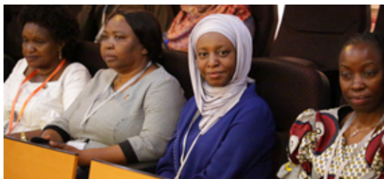
Watumishi kutoka Wizara ya Afya wakifuatilia uwasilishwaji wa hotuba ya bajeti ya Wizara ya Afya Bungeni.