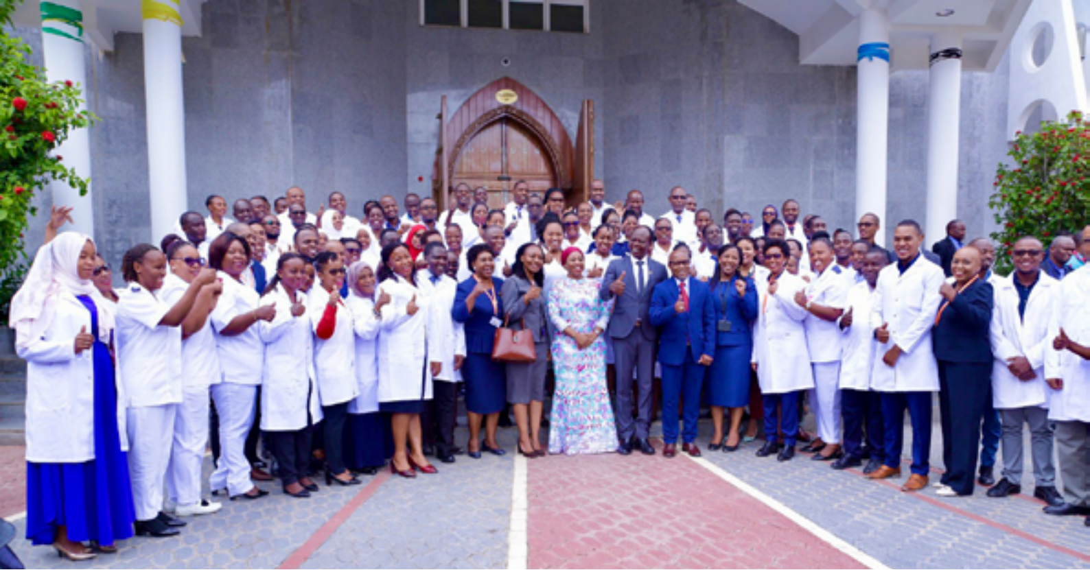
NI FURAHA KWELI KWELI: Picha ya viongozi wakuu wa Wizara ya Afya wakiongozwa na Waziri wa Afya Mhe. Ummu Mwalimu pamoja na timu ya madaktari bingwa wa afya ya uzazi, mama na mtoto mara baada ya kuwasilisha Hotuba ya Bajeti ya makadirio ya mapato na matumizi ya Wizara ya Afya kwa Mwaka wa fedha 2023/24. Timu ya madaktari hao inatarajiwa kutoa mafunzo kwa wataalam walio katika vituo vya kutolea huduma za afya kuanzia Hospitali za Wilaya na Vituo vya Afya ili kuwajengea uwezo watoa huduma kutoa huduma bora za afya ya uzazi mama na mtoto.